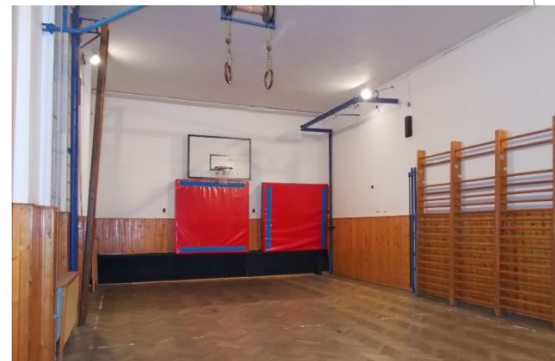
tělocvična pro II. stupeň ZŠ