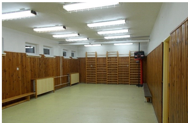
tělocvična pro I. stupeň ZŠ