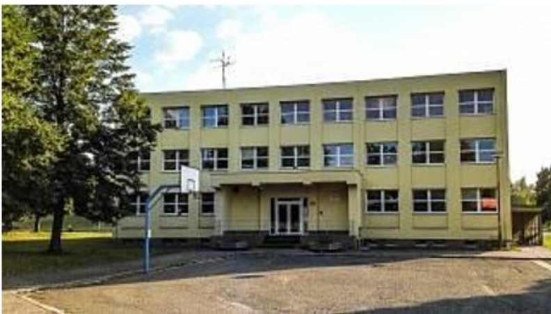
Na Lužci č.p. 660 - I. stupeň ZŠ