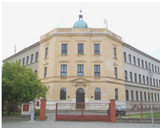
Masarykovo nám. č.p. 108 - II. stupeň ZŠ